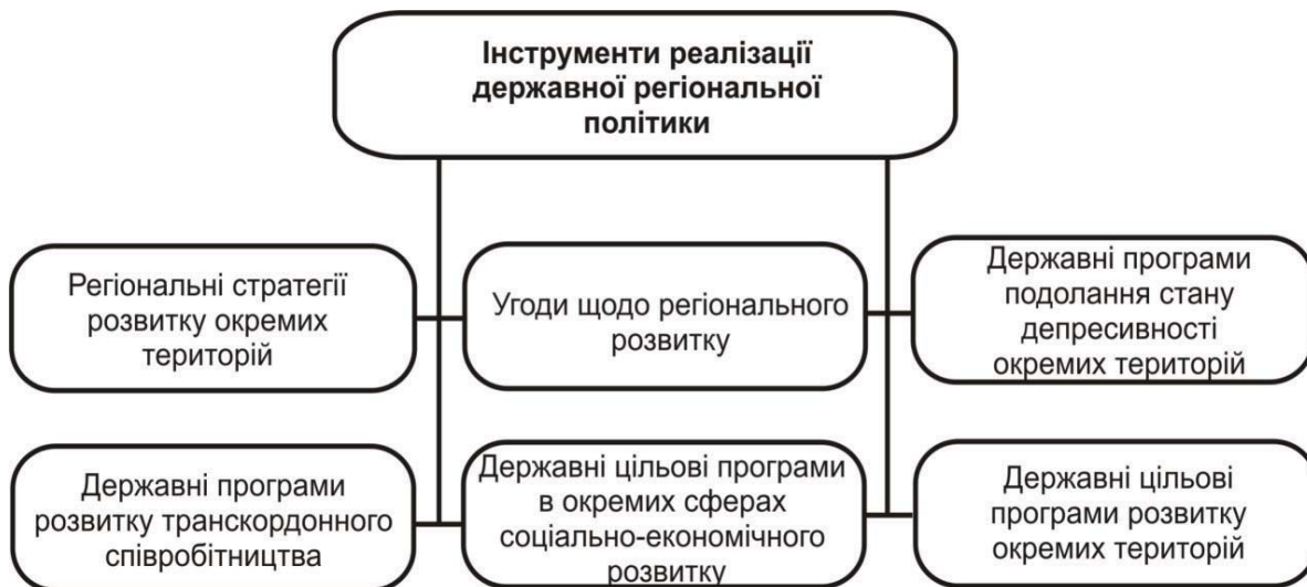
Рис. 2. Інструменти реалізації Державної стратегії регіонального розвитку України на період до 2020 р.

Щодо перших, то їх перелік залишається фактично незмінним із середини 2000-х рр. ХХ ст. (рис. 2). Практика показала, що, по-перше, використовуються не всі інструменти, по-друге, ефективність зазначених інструментів залишається низькою.