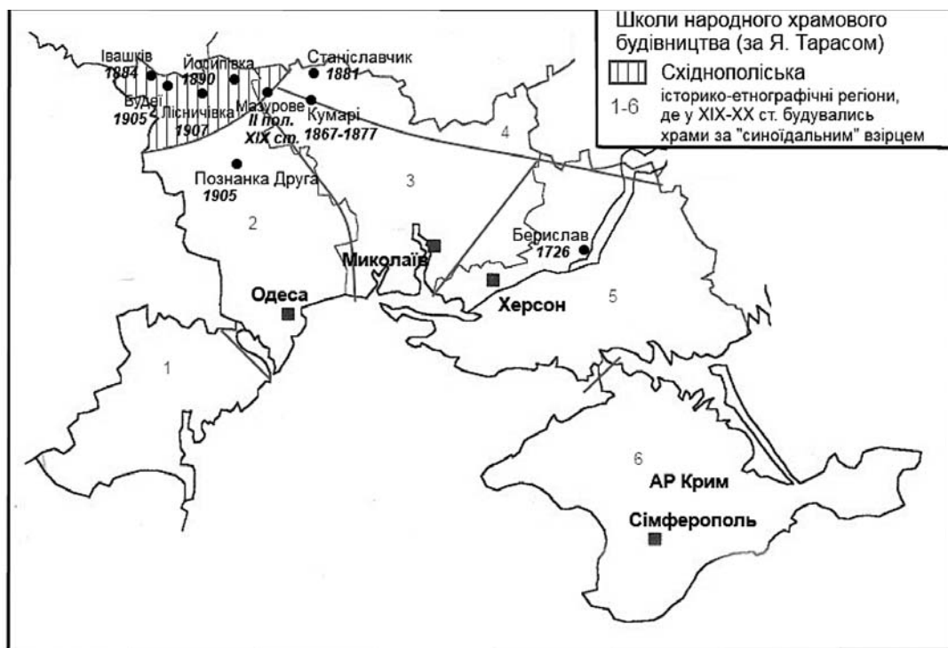
Рис. 2. Територіальне розташування пам'яток народного дерев'яного храмовбудівництва Півдня України

Головним конструктивним елементом дерев'яної церковної архітектури став квадратний зруб (вежа) із поземно укладених брусів чи колод, з'єднаних у кутах замками різних типів. Залежно від кількості зрубів українські церкви поділяють на дво-, три-, п'яти- чи дев'ятидільні. Вони мають переважно пірамідальну форму, від периферії внизу до найвищої бані. З XVI ст. у дерев'яному будівництві України