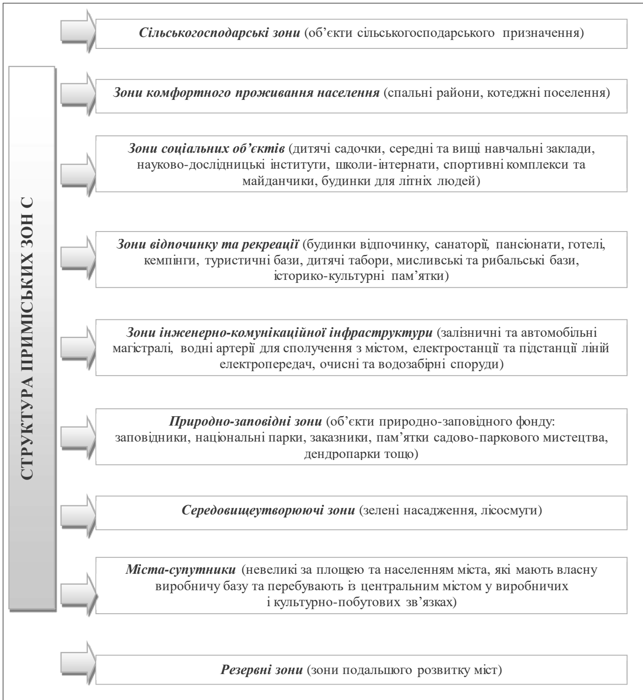
Рис. 2. Структурні елементи приміських зон (узагальнено авторами за [2; 8; 11; 13])

Розрізняють три типи окраїнних міст: «бумери» (boomers) – виникають на перетині транспортних магістралей та навколо ТРЦ і є найпоширенішим типом; «грінфілдси» (greenfields) – створюються як нові міста в рамках генпланів, головним чином на відкритих просторах на приміських окраїнах; «аптауни» (uptowns) – виникають на основі сусідніх міст