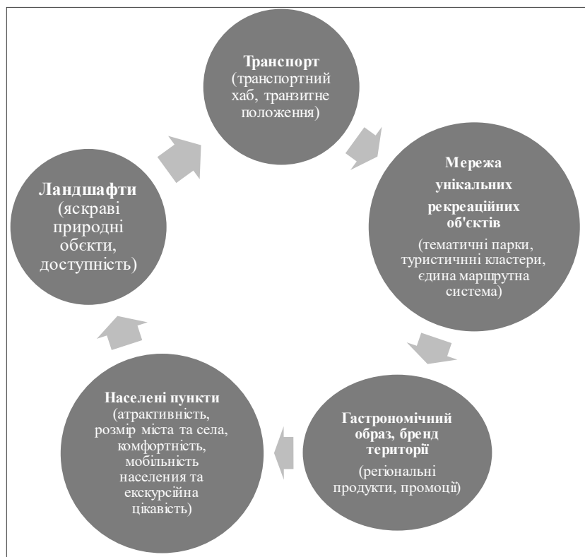
Рис. 1. Туристичне проектування території Правобережного Полісся

Виклад основного матеріалу дослідження. У першу чергу, гастрономічний туризм є засобом пізнання менталітету, вікових традицій та національної душі народу через культуру приготування та споживання їжі. Гастрономічна мандрівка – палітра, за допомогою якої турист може намалювати своє уявлення про ту або іншу країну. Їжа відчиняє таємницю духу народу, допомагає зрозуміти його менталітет.