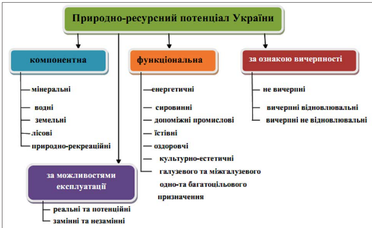
Рис. 2. Структура природно-ресурсного потенціалу України [2]

Під туристичними ресурсами розуміють сукупність природних та штучно створених людиною об'єктів, придатних для створення туристичного продукту. Як правило, туристичні ресурси визначають формування туристичної діяльності в тому чи іншому регіоні, наприклад, придатність території для санаторно-курортного лікування, наявність родовищ лікувальних мінеральних вод, озокериту, сприятливі кліматичні умови, екологічно чисте природне середовище тощо. При цьому чим більші запаси лікувальних ресурсів, вища їх лікувальна ефективність, тим вищу цінність