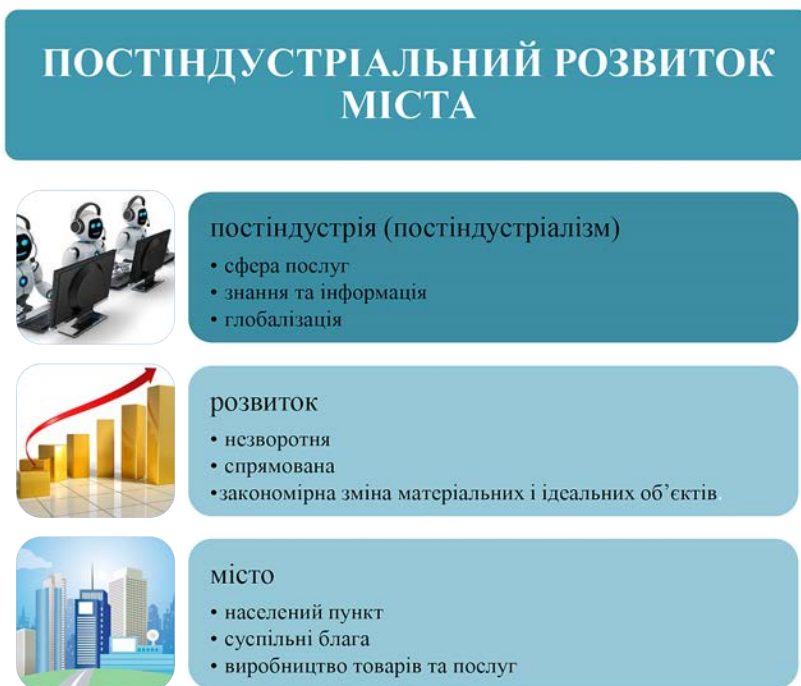
Рис. 1. Складники дефініції «постіндустріальний розвиток міста»

Перш ніж переходити до визначення суті поняття постіндустріального розвитку міста, слід чітко розділити його складники дефініції, а саме: постіндустрія, розвиток, місто (рис. 1).