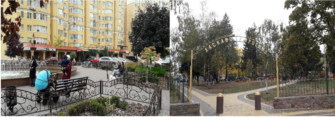
Рис. 1. Повсякденні практики проведення дозвілля жителями новобудов та старої (історичної) частини Софіївської Борщагівки