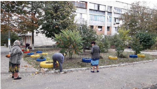
Рис. 2. Повсякденні практики самоорганізації громади у старій (історичній) частині Софіївської Борщагівки