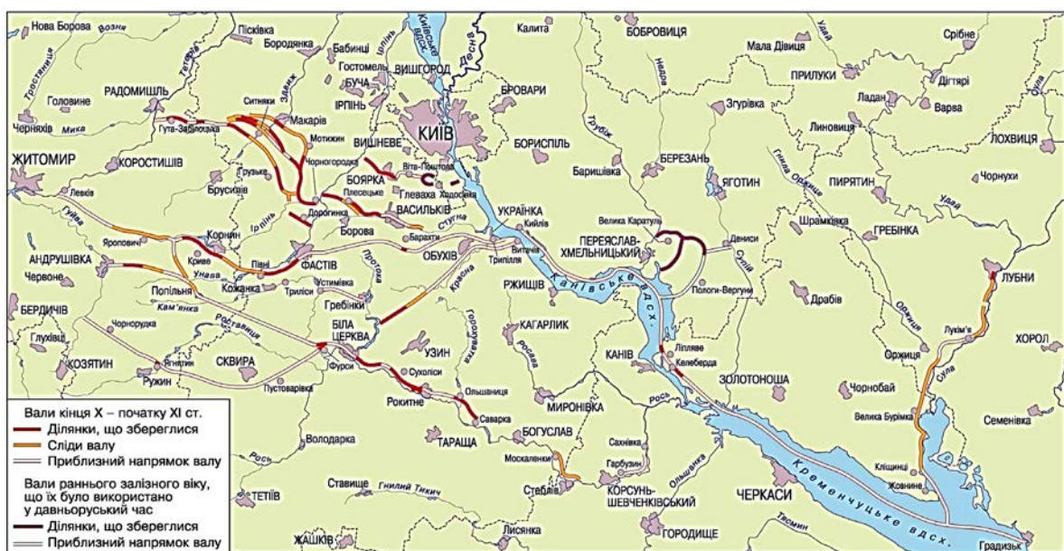
Рис. 3. Розташування Змієвих валів відповідно до [2]

Висновки. Порівняно невелика кількість об'єктів Всесвітньої спадщини ЮНЕСКО в Україні пояснюється не лише тим, що визначних об'єктів мало, а й тим, що деяким не приділено достатньої уваги. До таких об'єктів, які відповідають критеріям Конвенції про охорону