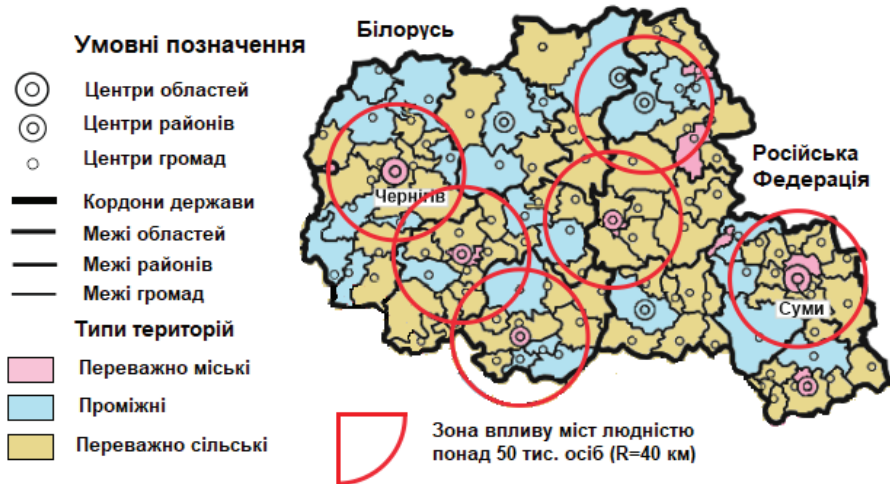
Рис. 2. Типи територіальних громад Чернігівської та Сумської областей