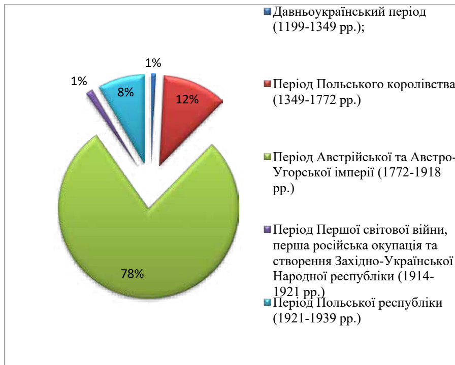
Рис. 2. Співвідношення кількості збудованих сакральних об'єктів Івано-Франківської області за періодами